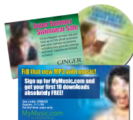
Mensajes de promociones personalizados