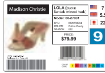
Identificación del producto utilizando imágenes